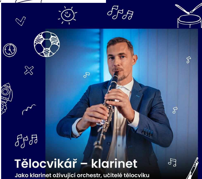
Tělocvikář – klarinet

Jako klarinet oživující orchestr, učitelé tělocviku dodávají škole energii a rytmus. Jejich dynamické hodiny podporují zdravý pohyb a vytvářejí harmonii – ve zdravém těle zdravý duch!